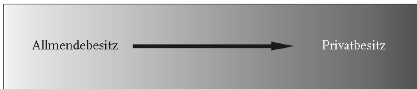
Abbildung 1: Die Standardlösung für die Tragik der Allmende

Meiner Ansicht nach beruht unsere kulturelle Blindheit gegenüber den Kosten fragmentierter Eigentumsverhältnisse auf diesem allzu einfachen Eigentumskonzept. Ohne es zu hinterfragen, nehmen wir an, die Lösung für das Problem der Übernutzung einer Open-Access-Ressource sei ihre Überführung in Privateigentum. Diese Logik erschwert den Blick auf mögliche Unternutzungsprobleme und macht es uns unmöglich, die unkartierte Welt jenseits des Privateigentums zu erfassen.