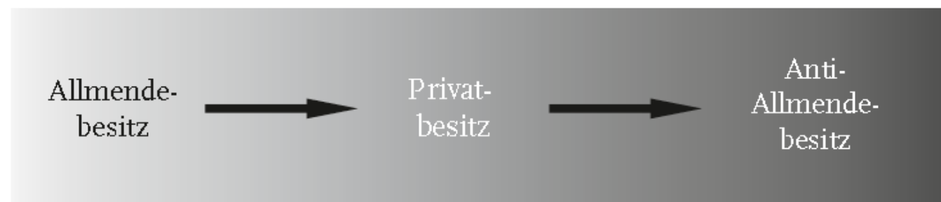
Abbildung 2: Die verborgene Seite des Eigentumsspektrums sichtbar machen